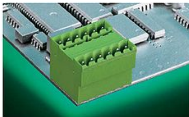
STL 975/.. G - 5.0 - V - GRÜN

2-24 polig, Rastermaß 5,0 mm Gewünschte Polzahl bitte einsetzen bei .. Bestellbeispiel s. Seite 11